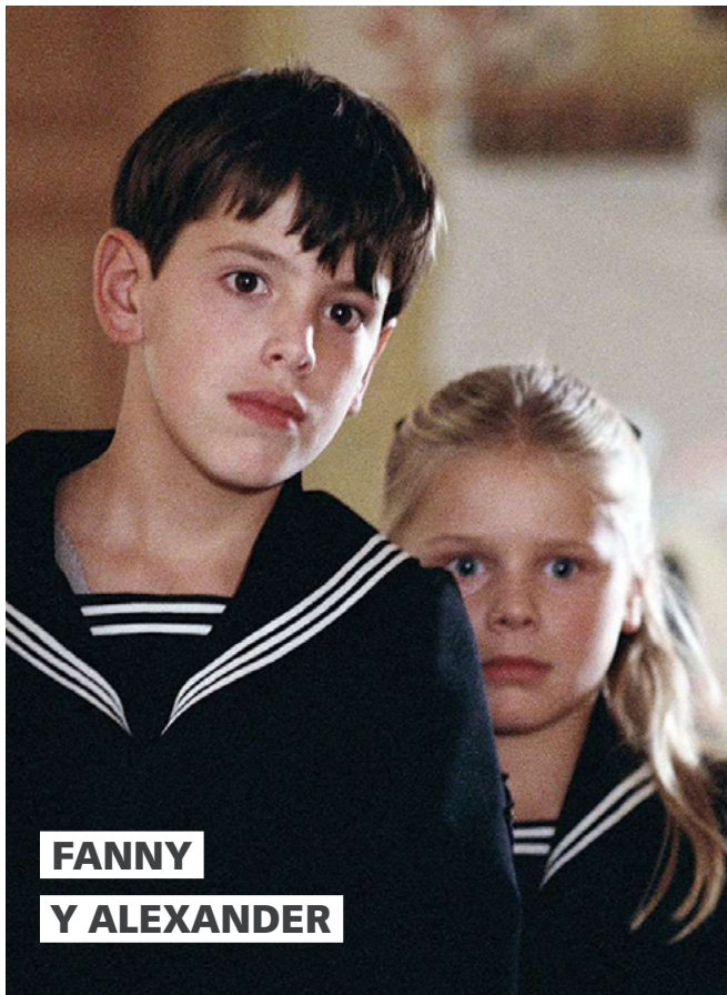
FANNY Y ALEXANDER