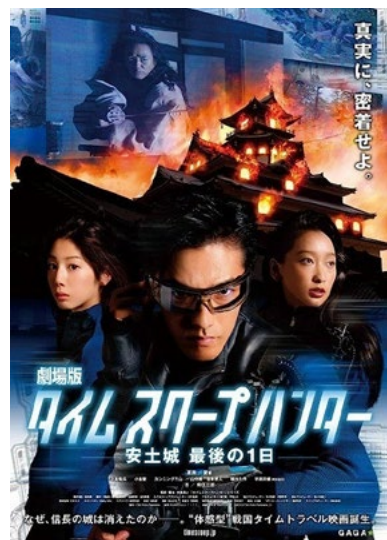
TIME SCOOP HUNTER TAIMU SUKUPU HANTA

DEL 13 AL 16 DE JULIO, EN INFANTA SALA 1