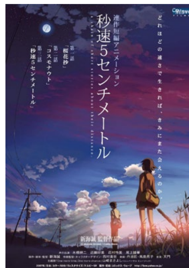
5 CENTÍMETROS POR SEGUNDO BYOSOKU GO SENCHIM ETORU

Japón/ 2016/ 114'/ Shinpei Miyashita/ Anim./ TE. Sinbad es un niño que sueña con viajar por todo el mundo. Un día, un collar cae del cielo, seguido por una misteriosa chica. Sinbad y la tripulación del barco Bahr parten en busca de la familia de la chica, la princesa Sana, que es la última sobreviviente de una legendaria familia de magos. BASADA EN LAS MIL Y UNA NOCHES