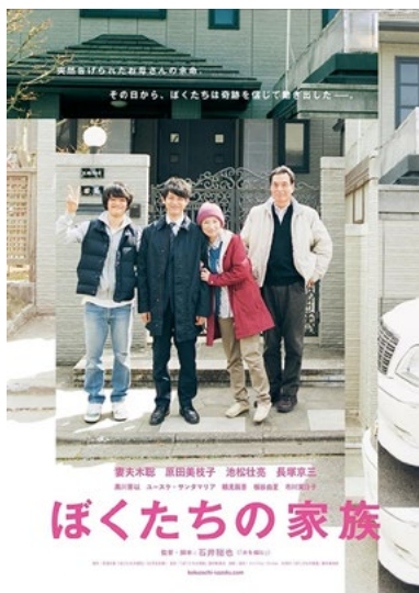
NUESTRA FAMILIA BOKUTACHI NO KAZOKU