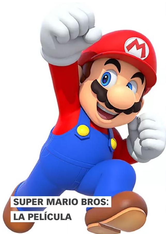
SUPER MARIO BROS: LA PELÍCULA