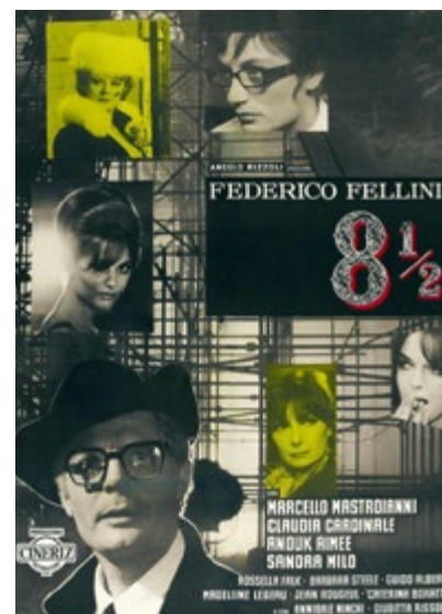
OCHO Y MEDIO OTTO E MEZZO