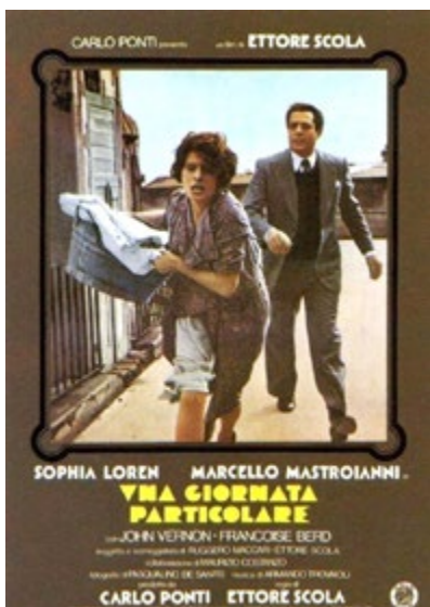
UN DÍA MUY PARTICULAR UNA GIORNATA PARTICOLARE

Ettore Scola/ 95'/ Italia-Canadá/ 1977/ Sophia Loren, Marcello Mastroianni, John Vernon. Una mujer casada, esposa de un fanático fascista, y un locutor radial que ha sido despedido por homosexual viven una fugaz relación amorosa en el momento en que Hitler visita a Mussolini en Roma. NOMINADO AL OSCAR A MEJOR PELÍCULA Y ACTOR (MASTROIANNI). COPIA RESTAURADA, SE EXHIBE EN HD